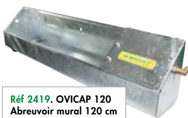
Réf 2419. OVICAP 120 Abreuvoir mural 120 cm Prix public HT 245 €

L'abreuvoir mural OVICAP 120, long de 120 centimètres répond aux attentes des éleveurs de chèvres et moutons qui souhaitent un abreuvoir plus petit que son grand frère l'OVICAP 240 pour un