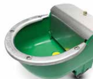
Réf 1615 Abreuvoir Lac 5A en fonte à niveau constant avec cadre antilapage prix public HT 94 €

Avec le système anti-lapage associé à un niveau constant dans l'abreuvoir, LA BUVETTE répond ainsi à une attente forte des éleveurs pour faciliter l'abreuvement des animaux, limiter le gaspillage d'eau mais aussi éviter de souiller les litières. ■