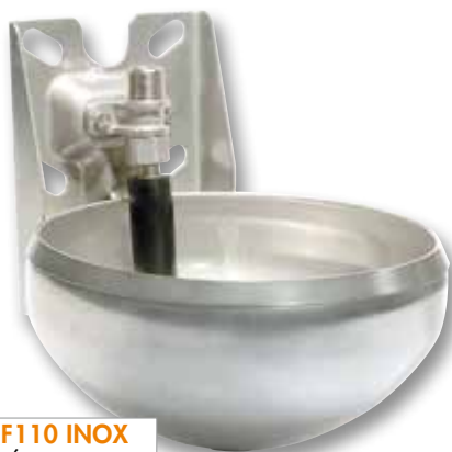
F110 INOX RÉF 3209

Les abreuvoirs F110 et F130 sont appréciés des éleveurs depuis plus de 10 ans. Mais l'écoute des préoccupations des éleveurs et la recherche permanente de solutions adaptées aux élevages a conduit les équipes de recherche et développement de LA BUVETTE à une conception nouvelle de ces deux abreuvoirs existants pour une plus grande satisfaction des éleveurs et de leurs animaux.