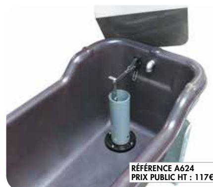
RÉFÉRENCE A624 PRIX PUBLIC HT : 117€*

Ainsi, le DAIRY-BAC 400 devient un abreuvoir de grande capacité pouvant satisfaire simultanément 5 vaches laitières à tout moment de la journée.