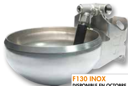
F130 INOX DISPONIBLE EN OCTOBRE 2016 - RÉF 3217

Pour rappel, le raccord d'alimentation pour le F110 Inox se fait par le haut alors que le F130 Inox dispose d'un branchement multidirectionnel. Il conviendra aux installations en circulation antigel munies d'un SPEED-FLOW ou autre. Ces deux options permettent une adaptation à tous les élevages.