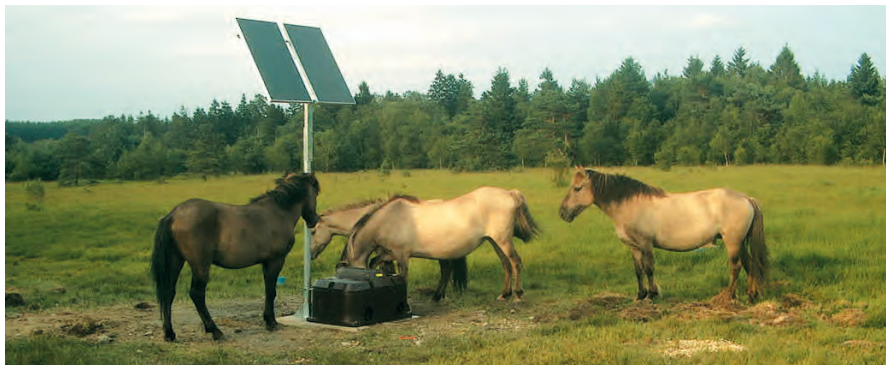
Thermo-Solar en place aux Hauts Buttés.

Alain Bernard est maire de Monthermé, une commune des Ardennes. Celle-ci dispose d'une zone naturelle sauvage, le marais des Hauts Buttés, sur laquelle la municipalité a placé des chevaux pour entretenir le site par des moyens écologiques.