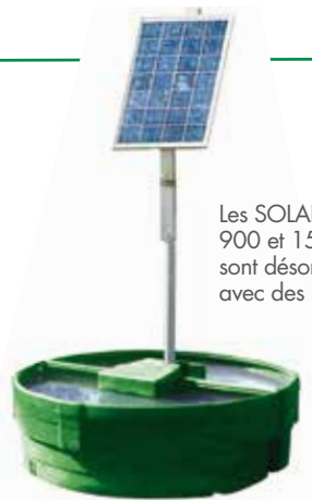
Les SOLAR-FLOW 900 et 1500 litres sont désormais livrées avec des bacs verts.