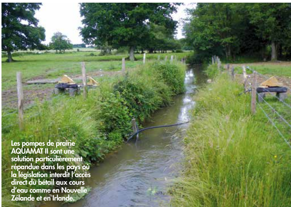
Les pompes de prairie AQUAMAT II sont une solution particulièrement répandue dans les pays où la législation interdit l'accès direct du bétail aux cours d'eau comme en Nouvelle Zélande et en Irlande.