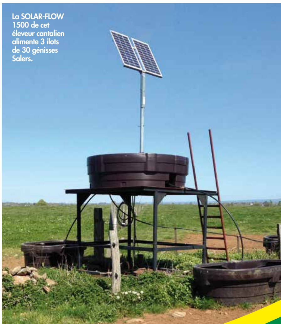
La SOLAR-FLOW 1500 de cet éleveur cantalien alimente 3 ilots de 30 génisses Salers.