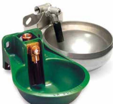
FORSTAL et F130 INOX