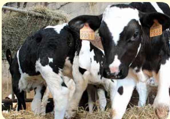
Auges disponibles dès fin mai 2015.

La cuve monobloc, fabriquée en polyéthylène haute densité de qualité alimentaire et traitée anti-UV, est garantie 5 ans. La mise en place est très rapide grâce à un montage aisé. L'entretien des auges est facile : lavables au nettoyeur haute pression, résistantes à l'acidité, bouchon de vidange démontable sans outil (diamètre 30 mm) et formes intérieures arrondies. Le châssis est très résistant : acier galvanisé à chaud, tubes solides de 27 mm de diamètre dont un renfort central sous la cuve, 4 pieds réglables en hauteur tous les 5 cm (de 31 à 46 cm), 4 ou 6 points d'attache (selon le modèle) mais sans liaison fixe, ce qui évite les casses liées aux différences de dilatation entre le polyéthylène et l'acier.