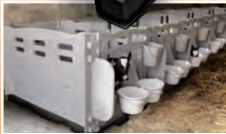
6 cases : 19 parois - côte à côte