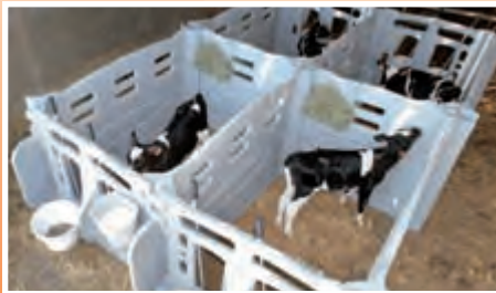
4 cases : 12 parois - côte à côte et dos à dos

Le caillebotis anti-dérapant en PE apporte plus de confort et d'hygiène.