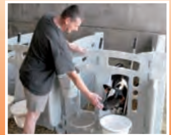
2 cases : 5 parois - contre un mur